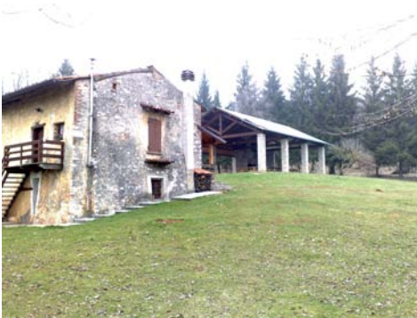
Fienile del Tesio